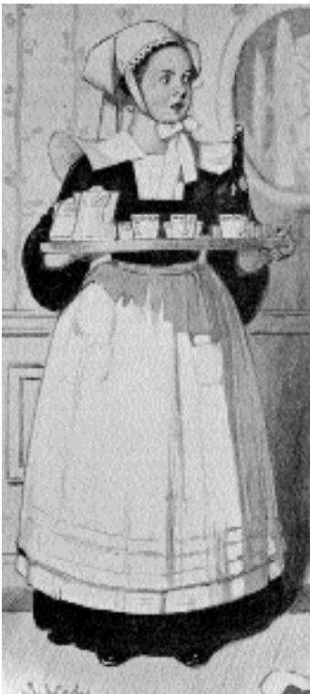
Exposition "Bécassine – Banania, destins croisés". La bonne bretonne.

De l'assimilation à l'affirmation, cette étude comparée des imageries bretonnes et africaines offre encore d'intéressantes similitudes. Ainsi on ne peut nier l'importance de l'activité sportive dans la modification du regard sur cet autre, auquel on dénie à l'origine un réel droit à l'égalité. On sait, par exemple, l'importance qu'ont revêtue aux États-Unis, à la Belle Époque, les premières victoires de boxeurs noirs sur leurs adversaires blancs, apportant ainsi un démenti radical à la représentation alors courante de la supériorité physique du corps blanc. En France, les sportifs africains, notamment en athlétisme, vont dans les années quarante-cinquante, souvent