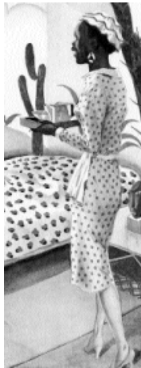
Exposition "Bécassine – Banania, destins croisés". La bonne africaine.

Une telle exposition, présentée autant en région parisienne que dans des villes bretonnes, n'est évidemment pas sans provoquer des réactions, sans nourrir quelques débats... et c'était bien là sa raison d'être.